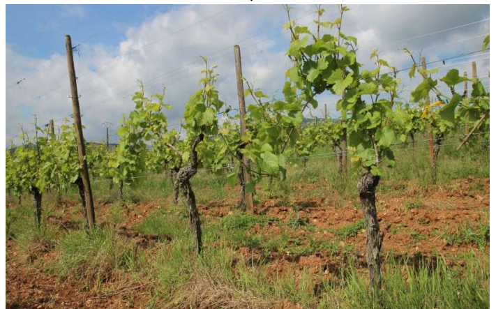
ゲヴェルトトラミネール ゾンネングランツの畑(5月)

ゲヴェルトトラミネール種100%。ストラズブルグの南にあるコルマールの町の近くにゾンネングランツの区画があります。この区画の標高は約250メートルで粘土石灰質土壌が主です。品種特有のミネラルが素晴らしく、肉厚かつオイリーで甘みの強いワインですが、酸味もしっかりあるので飲み飽きしません。「SONNENGLANZ (ゾンネングランツ)」とは太陽の輝きという意味です。