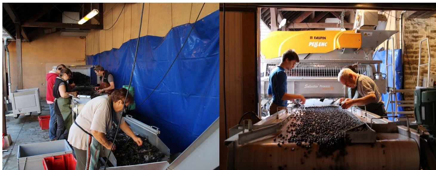
除梗前(左)と除梗後(右)の厳しい2段階選別の様子

ピノ ノワール種100%。基本的にはフランス国内用として生産されており、残念ながら日本に入ってくるのは稀です。ジュヴレ シャンベルタン村の「Champs Franc (シャン フラン)」という区画の葡萄が中心でクロド ヴジョの麓にある区画の葡萄も使われています。ブルゴーニュ ブランと同じく買い葡萄も足されているのでこちらもネゴシアン物になります。色調は淡いですが熟したフランボワーズのようなアロマ豊かで果実味たっぷりのワインです。