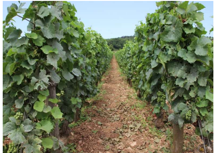
青々と葉が茂るシャンベルタンの畑(7月)

ピノ ノワール種100%。所有面積は約2haでそのうち約1haを馬で耕作しています。1957～64年に植えた区画と1912年に植えられた1番古い木のある区画、その他に1945年、1985年、1992年に植えられた区画が3つに分かれており、土壌は泥灰土や粘土石灰質です。太陽のようなシャペル シャンベルタンと大地のようなラトリシエール シャンベルタンの両方の要素を持っており、骨格がしっかりしていて様々な要素が凝縮していますが、10年以上経たないとその真価を見ることは出来ません。