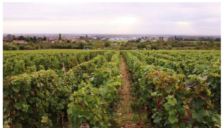
マルサネ「Grand Poirier(グラン ポワリエ)」の区画(9月)

ピノ ノワール種100%。葡萄の木の平均樹齢は50年で畑は約1.4ha、マルサネ村に位置する「Grasses Têtes(グラス テット)」という区画とクーシェイ村に位置する「Grand Poirier(グラン ポワリエ)」などの区画の葡萄が使われています。チャーミングな果実味とみずみずしい酸味、余韻に軽やかなタンニンを感じられ、飲みやすくもしっかりとした味わいです。