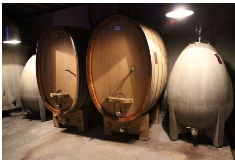
伝統的な楕円形のタンクと新しいコンクリート製の卵型タンク

トカイピノグリ種100%。ストラズブルグの南のコルマールの町の近くにゾンネングランツの区画があります。この区画の標高は約250メートルで粘土石灰質が主でムール貝の化石が多くみられる畑です。果実味たっぷりで厚みがあり、とてもオイリーでリッチな味わいです。甘いワインになりやすい葡萄品種なので、葡萄をあまり成熟させずにフレッシュな味わいになるように心掛けています。若いうちは品種特有のほろ苦さと固さも見られます。